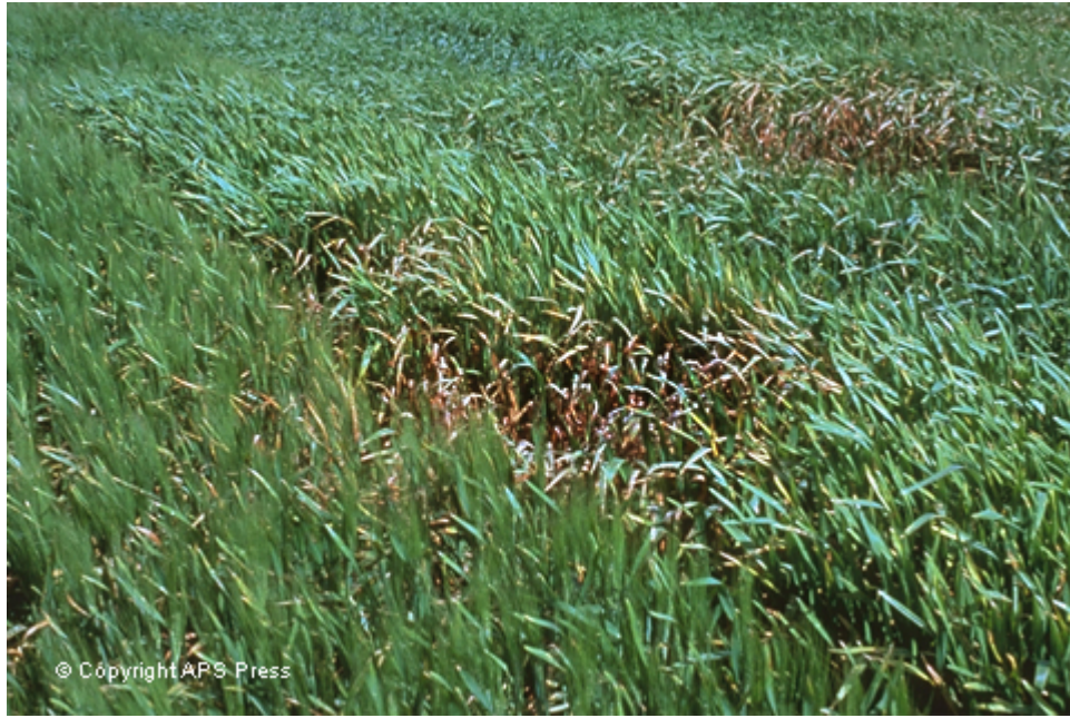
تصویره- علايم بيماري کچلي جو در مزرعه