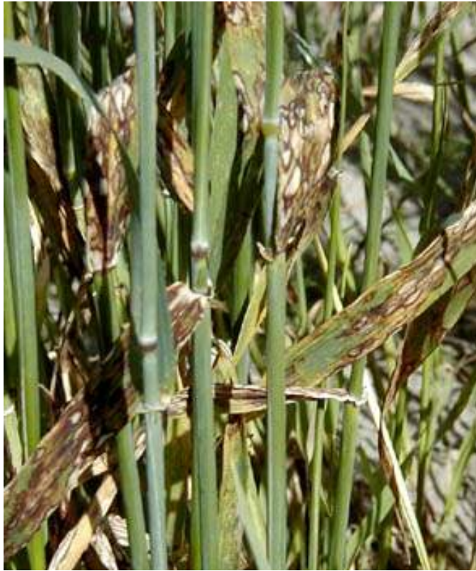
تصویر ۳- علائم بیماری کچلی روی یک بوته جو