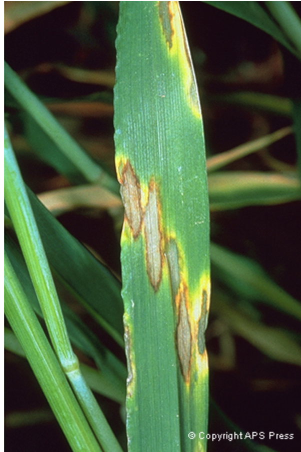
تصویر ۱- علائم اولیه بیماری کچلی روی برگ های جو