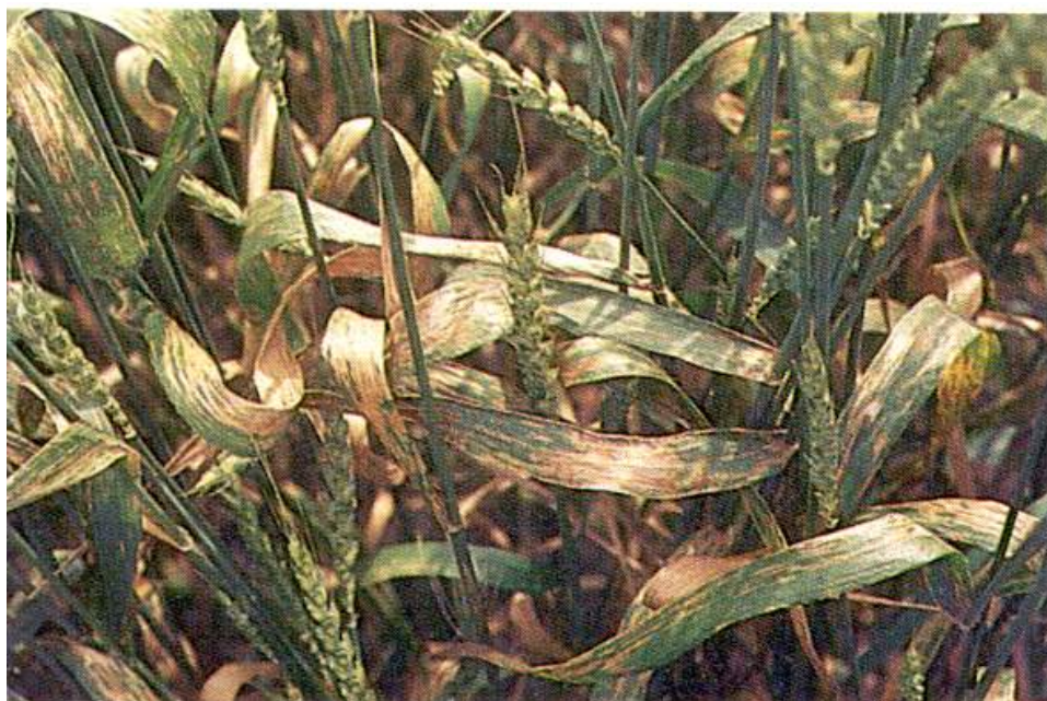
شکل ۳- مزرعه گندم آلوده به بیماری سپتوریوز برگ